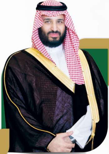
الأمير محمد بن سليمان بن عبدالعزيز السجوي

“ديننا الإسلامي الحنيف دين تكافل وتعاضد وتأزر وشريعتنا الإسلامية تؤكد على العمل الخيري.”